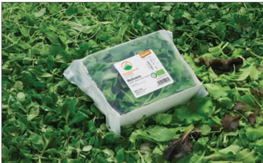
Биопластики на основе растительного сырья, но не отличающиеся по свойствам от полученных традиционно, только начинают свой путь, однако эксперты Pira International утверждают, что спрос на рынке упаковки сместится от биоразлагаемых полимеров к биоупаковке, изготовленной из экологически чистых материалов

Следует отметить, что в последнее время проблема решения вопроса био-