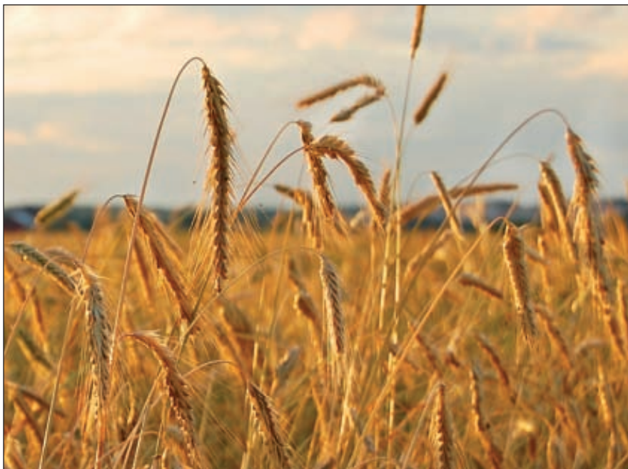
В России производство биополимеров, увы, практически отсутствует. Спрос на биоупаковку формируют сети премиального сегмента, которые подчеркивают, что их продукция продается именно в экологичной упаковке. В этом случае за такой товар доплачивает потребитель, а не производитель

Два химических гиганта BASF и Bayer AG занимаются получением биоразлагаемых синтетических пластиков путем синтеза соответствующих полиэфира и полиэфирамидов. На основе такого полиэфира еще в 1995 году BASF освоил производство биоразлагаемого пластика Ecoflex F, применяемого для изготовления мешков, сельскохозяйственной пленки, гигиенической пленки, для